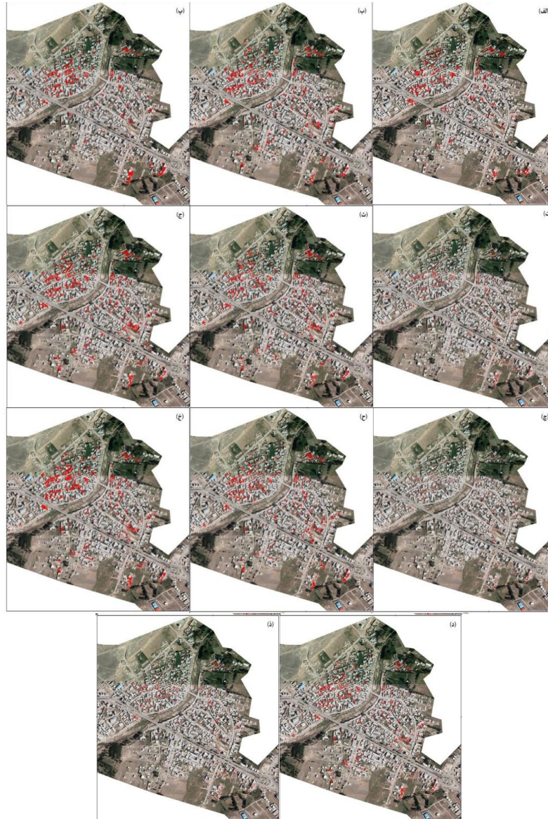
شکل ۲. مناطق تخریبی استخراج شده با استفاده از هر شاخص، شاخص‌ها به ترتیب از سمت راست - بالا: الف (Brightness)؛ ب (Max.diff)؛ پ (Standard Deviation)؛ ت (Asymmetry)؛ ث (Border)؛ ج (Compactnes)؛ چ (Density)؛ ح (Elliptic Fit)؛ خ (Rectangular Fit)؛ د (Roundness)؛ ذ (Shape index).